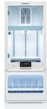
UltiMaker S7 Pro Bundle