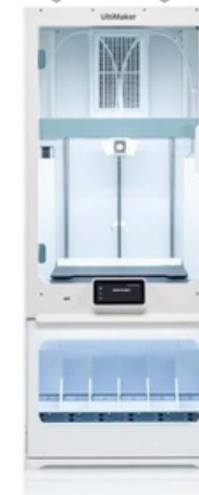
UltiMaker S7 Pro Bundle