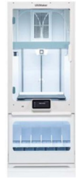
UltiMaker S7 Pro Bundle